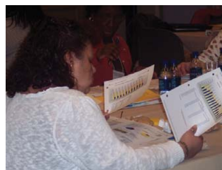
Foto de abajo: equipos de la Carrie Gosch Elementary y Block Jr. High School del Este de Chicago.

Los Participantes del Instituto de Mejoramiento de las Escuelas analizaron los datos de los logros académicos de los estudiantes de su escuela y desarrollaron planes para alcanzar a los padres y para ayudar a los estudiantes en dificultad a alcanzar el éxito.