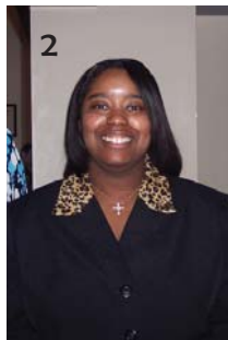
Many Guest Speakers were able to share their expertise at the Institute and provide participants with suggestions and inspiration. Thank you to all who were able to join us!